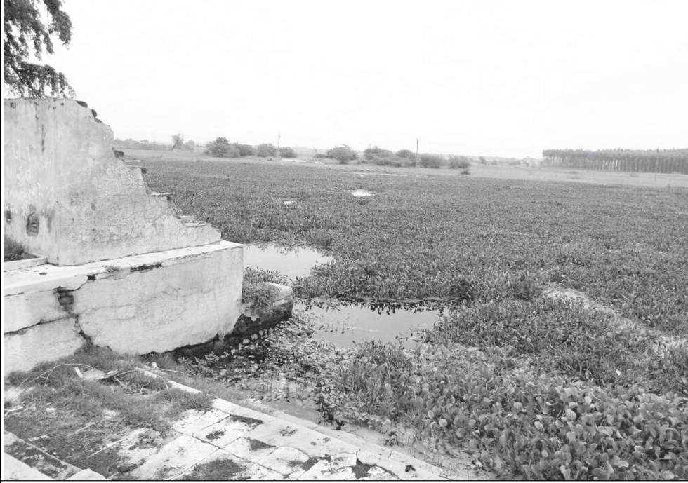
સાવલીનગરનું તળાવ ગંદકીથી ખદબદતું તસ્વીરમાં નજરે પડે છે.

(પ્રતિનિધિ)સાવલી, તા. ૨૫ સાવલીનગર પાલિકાની મહિલા સદસ્ય દ્વારા પાલિકાની તળાવની સફાઈ માટે આપેલા કોન્ટ્રાક્ટની ૧૮ લાખ રૂપિયાની રકમમાં અધિકારી અને પદાધિકારી સામે ભ્રષ્ટાચારની સોચ તાકીને જીલ્લા કલેક્ટર પ્રાંત ઓફિસર અને જીલ્લા મ્યુનિસિપલ અધિકારીને પત્ર પાઠવીને તપાસ કરવાની માંગ કરતા સમગ્ર તાલુકામાં ચર્ચાનો વિષય બન્યો છે. અને આક્ષેપ સાથે તપાસની માંગ કરી છે.