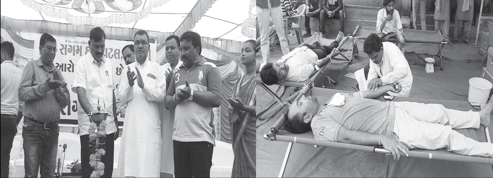
ક્યાંટ વિધાવિનય પ્રાયમરી સ્કુલમાં સર્વરોગ નિદાન કેમ્પ યોજાયો તે તસ્વીરમાં નજરે પડે છે.