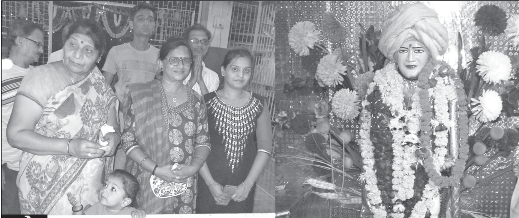
ડભોઈ ડભોઈનગરમાં જલારામ બાપાની જન્મજયંતિ ભારે શ્રદ્ધા અને ભક્તિભાવ પુર્વક ઉજવવામાં આવી હતી. એસટી ડેપોથી સ્ટેશન રોડ જવાના માર્ગે પર આવેલ મંદિરમાં સંત શિરોમણી પ. પૂ. શ્રી જલારામ બાપાના દર્શન થાય છે. બીજી તરફ નગરમાં પ. પૂ. શ્રી જલારામ બાપાના દર્શનાર્થે ઉમટી પડેલ ભાવિક ભકતજનો નજરે પડે છે.

મહાઆરતી કરવામાં આવી હતી. આ સમયે જલારામ મંદિરે સેકડોની સંખ્યામાં જલારામ ભકતો ઉમટી પડ્યા હતાં. જેથી દર્શનાર્થે લાંબી કતારો મંડાઈ હતી. એસટી ડેપોથી રેલવે જવાના માર્ગે મેળા જેવું વાતાવરણ જોવા મળ્યું હતું. ભજન તથા સત્સંગના કાર્યક્રમ સાથે જલારામ જયંતિની ઉજવણી પૂર્ણ કરવામાં આવી હતી. આમ ઉત્સવપ્રિય દર્ભાવતી નગરીમાં આજરોજ જલારામ જયંતિની દબદબાભરે ઉજવણી કરવામાં આવી હતી. નગરમાં આવેલ હિરાભાગોળ બહાર અને એસટી ડેપો પાસે આવેલ બંને મંદિરોમાં ઉત્સાહ પુર્વક જલારામ જયંતિની ભકતજનો દ્વારા ઉજવણી કરવામાં આવી હતી. રાત્રે ૬.૦૦ કલાકે રાખેલ ભજનના કાર્યક્રમમાં શ્રદ્ધાળુઓનો મહાસાગર ઉમટ્યો હતો. દર્ભાવતી નગરીમાં આજરોજ જલારામ જયંતિની દબદબાભરે ઉજવણી કરવામાં આવી હતી.